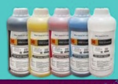
INCHIOSTRI A BASE ACQUA