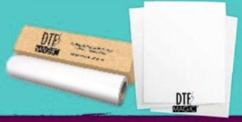
ROTOLI O FOGLI CPN STACCO A CALDO